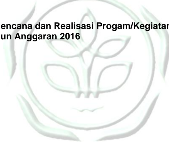
Tabel 11. Rencana dan Realisasi Progam/Kegiatan BBPP Kupang Tahun Anggaran 2016

Rencana dan realisasi kegiatan BBPP Kupang Tahun Anggaran 2016 selengkapnya termuat dalam tabel berikut ini.